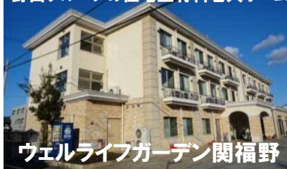
ウェルライフガーデン 関福野