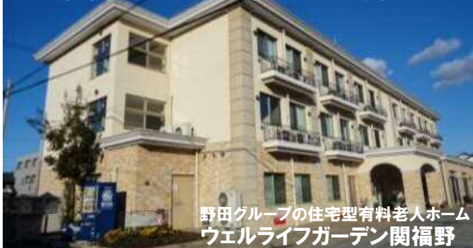
野田グループの住宅型有料老人ホーム ウェルライフガーデン関福野

企画・設計・施工 市場マーケティング 各種申請手続き 土地紹介 事業化計画 補助金取得 等